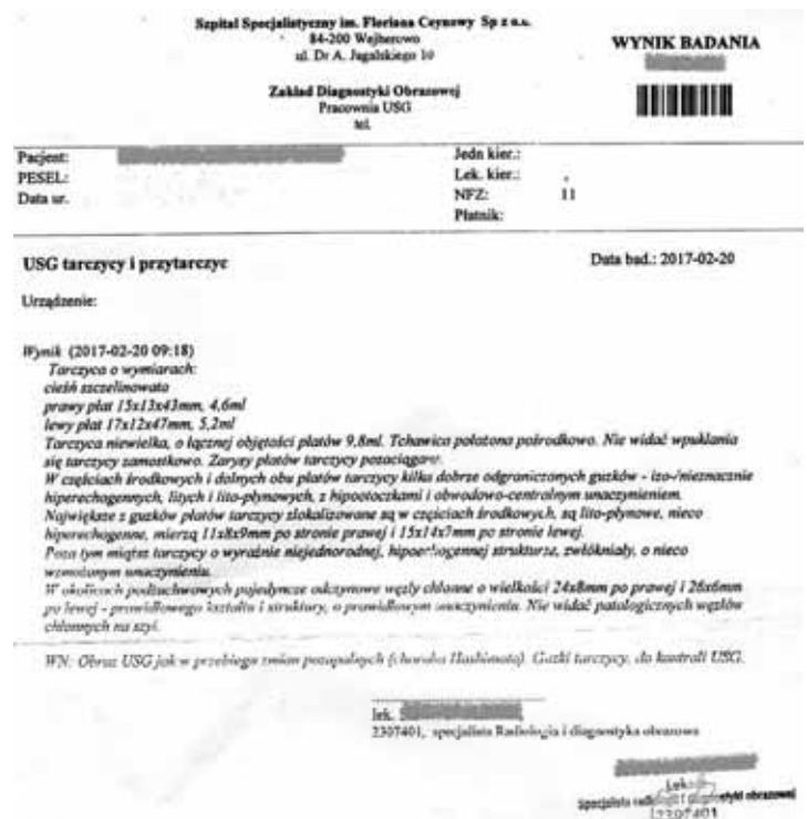
Figura 2. Descrierea ecografiei tiroidei, prima analiză (20/02/2017).